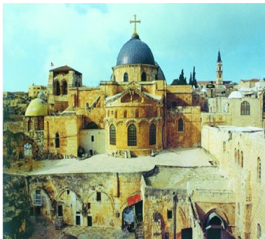
Иерусалим. Храм Воскресения Христова (Гроба Господня).

на основании Евангелия (от Матфея, 28-я глава, от Марка, 16-я глава, от Луки, 24-я глава, от Иоанна, 20-21 главы), святоотеческих толкований и житий святых.