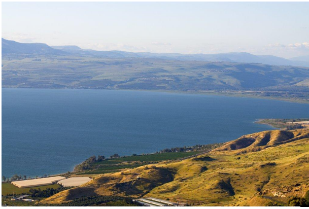
Тивериадское море (озеро) в Галилее