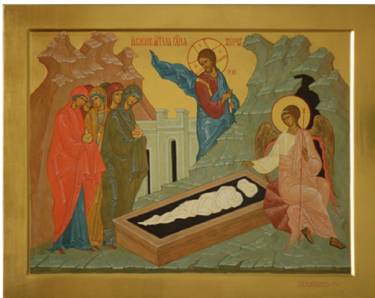
Мироносицы у Гроба Господня. Явление им Ангела.

момент явился Архангел Гавриил. Архангел возвестил Ей о Воскресении Её Сына, на основании чего мы поём песнь: «Ангел вопиаше Благодатней: чистая Дево, радуйся ...».