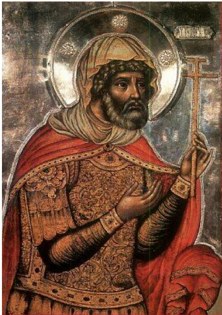
Святой мученик Лонгин сотник

7. Лонгин и другие стражники «объявили первосвященникам о всем бывшем» (Мф. 28: 11).