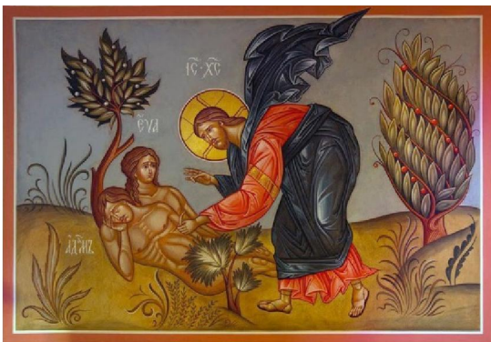
Икона. Сотворение Евы из ребра Адама

3. Учение о спасении человека (было разработано в XI в.), с которым связаны: а) ошибочное представление об Адаме и Еве (первые люди, наши прародители) и их отношениях с Богом, о первородном грехе; б) учения о удовлетворении Богу за грехи, чистилище, сокровищнице заслуг и индульгенциях. От чего человеку нужно спастись? Православие говорит – от греха, который есть –