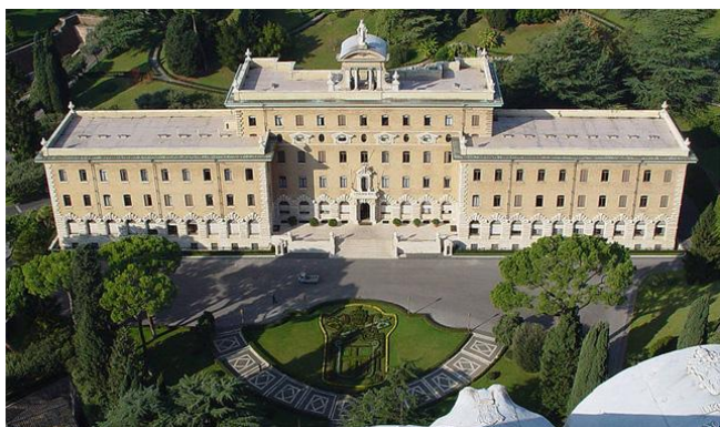
Ватикан. Здание администрации Римо-католической церкви.