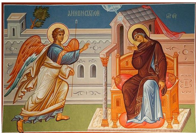
Благовещение Пресвятой Богородицы

Дева Мария посетила Иерусалим и передала в храм готовое рукоделие (часть новой завесы для храма), которое она готовила по поручению первосвященника 14 .